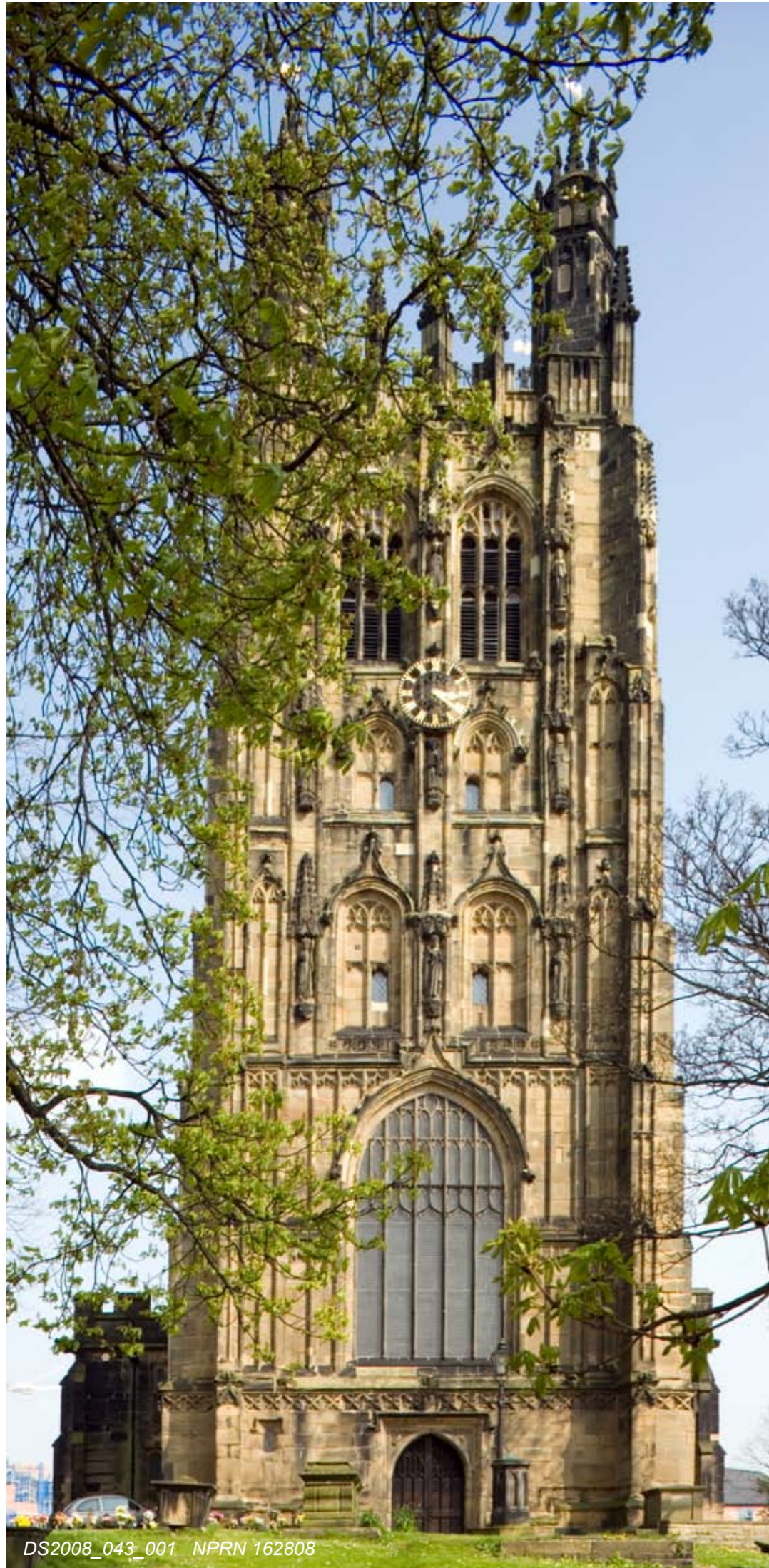
DS2008_043_001 NPRN 162808