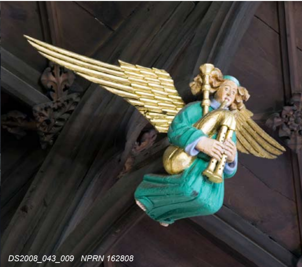
DS2008_043_009 NPRN 162808