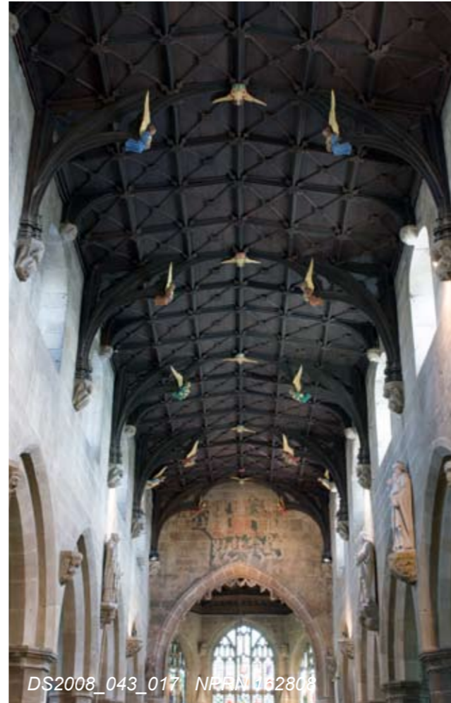
DS2008_043_017 NPRN 162808

St Giles's is one of the finest late-medieval town churches in Wales. It was rebuilt in a lavish Perpendicular style following a serious fire in the late fifteenth century. The nave roof is spectacular and the tower was regarded as one of the Seven Wonders of North Wales.