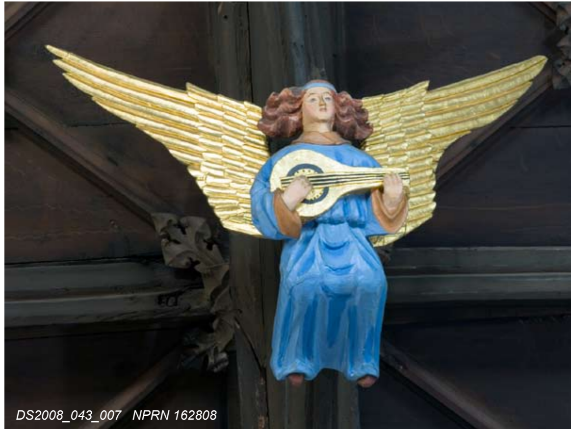
DS2008_043_007 NPRN 162808

Above: Nineteenth-century line drawing showing Perpendicular detail of the tower ( Archaeologia Cambrensis , 1885).