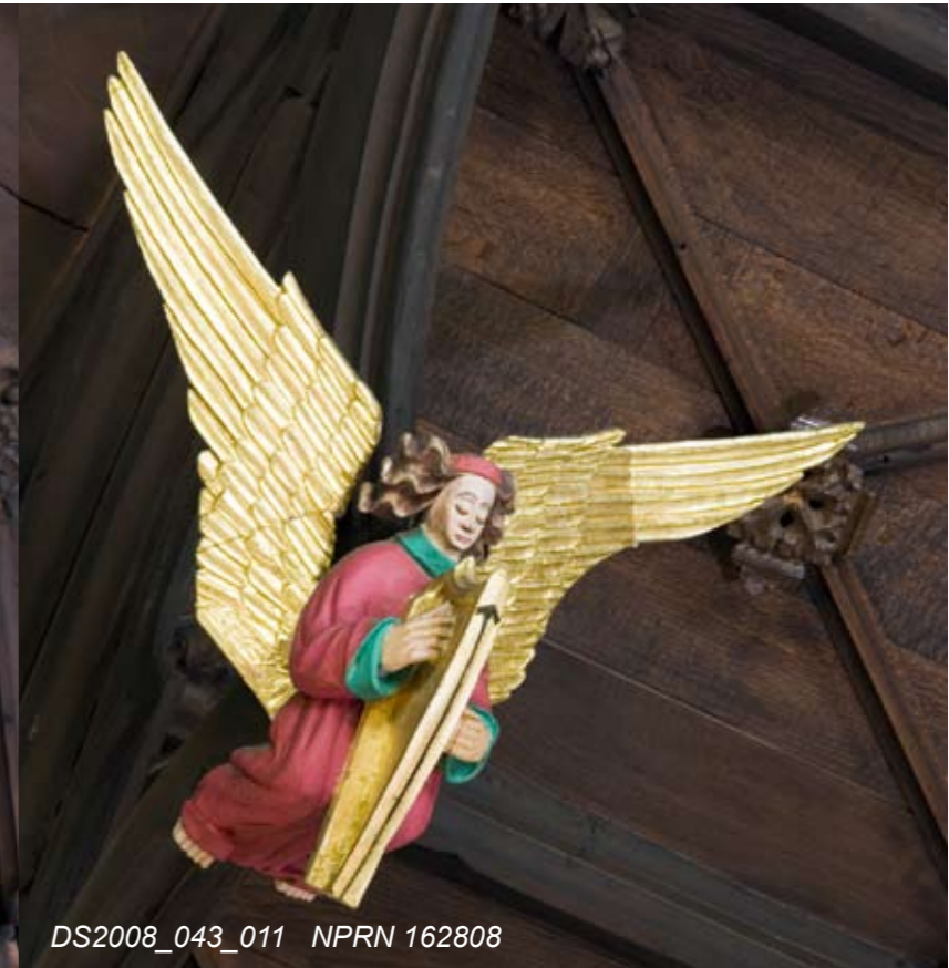
DS2008_043_011 NPRN 162808