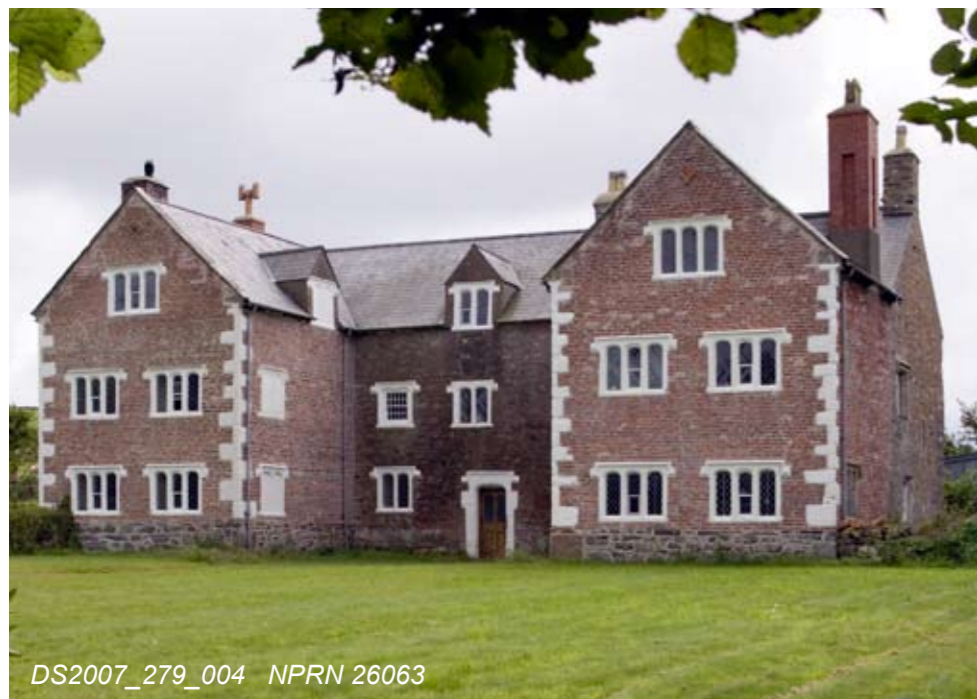
DS2007_279_004 NPRN 26063