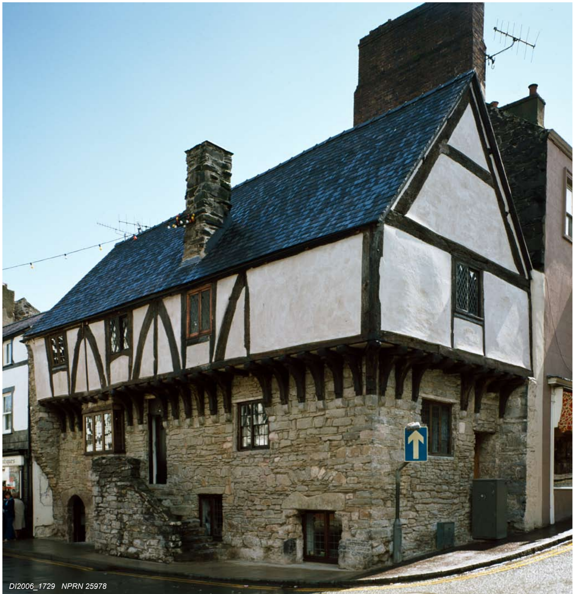
DI2006_1729 NPRN 25978