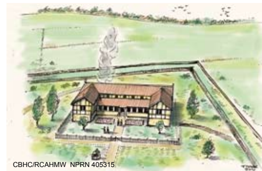
Uchod: Adluniad bras o fila Rufeinig Abermagwr. Caiff ei fireinio ar ôl y cloddio arbrofol. Byddem ni'n disgwyl i'r adeilad fod wedi bod yn gartref i ffermwr neu dirfeddiannwr cyfoethog ac iddo fod wedi sefyll ar ganol ystâd fawr. Dangosir mwg yn codi o ystafell dân yr hypocawst yn y cefn.

Above: Abermagwr Roman villa. An aerial view taken in the drought of 2006, showing cropmarks of the large rectangular villa enclosure (a) bottom right, by the river, with the villa footings (b) and annex (c) also visible. Cropmarks of a circular Iron Age defended farm, which pre-dates the villa, can be seen upper left (d).