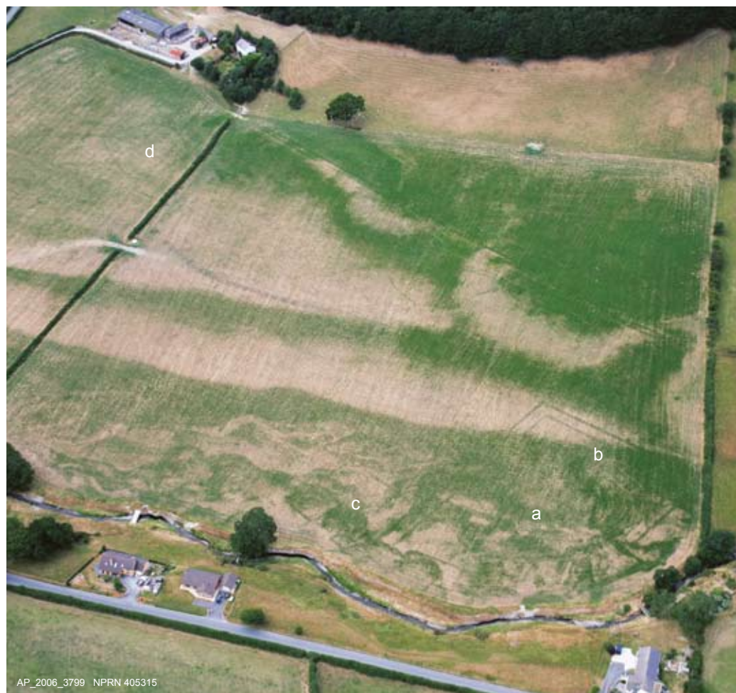
Uchod: Fila Rufeinig Abermagwr. Awyrlun a dynnwyd adeg sychder 2006. Mae'n dangos ôl cnydau lloc mawr petryal y fila (a) gwaelod, de, wrth yr afon, ac mae sylfeini'r fila (b) a'r anecs (c) hefyd i'w gweld. Uchod chwith (d), gwelir ôl cnydau fferm gron ac amddiffynedig o'r Oes Haearn a godwyd cyn y fila.

Left: Abermagwr villa geophysical survey by David Hopewell, Gwynedd Archaeological Trust, for the Royal Commission, showing the great double-ditched villa enclosure, an annex lower left, and the floor plan of the villa upper right.