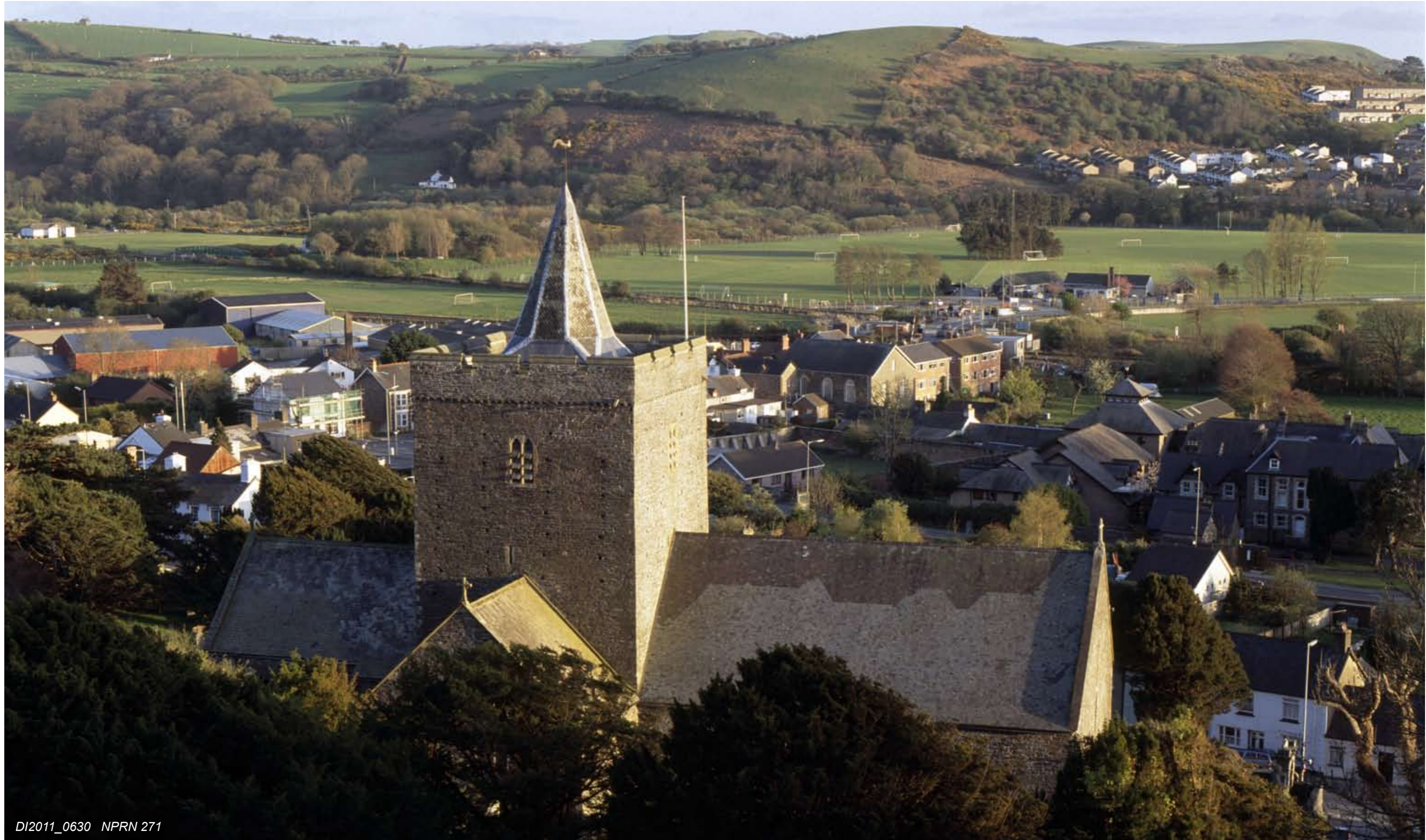
DI2011_0630 NPRN 271