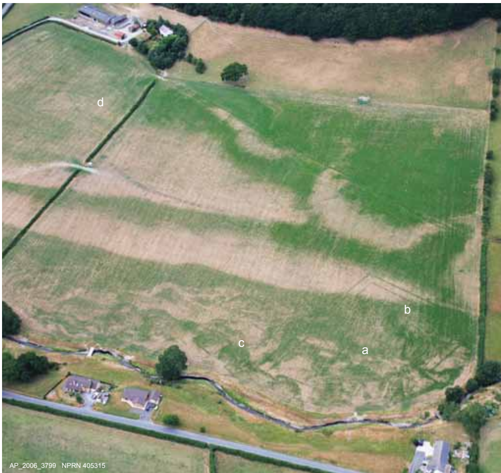
Uchod: Fila Rufeinig Abermagwr. Awyrlun a dynnwyd adeg sychder 2006. Mae'n dangos ôl cnydau lloc mawr petryal y fila (a) gwaelod, de, wrth yr afon, ac mae sylfeini'r fila (b) a'r anecs (c) hefyd i'w gweld. Uchod chwith (d), gwelir ôl cnydau fferm gron ac amddiffynedig o'r Oes Haearn a godwyd cyn y fila.

Left: Abermagwr villa geophysical survey by David Hopewell, Gwynedd Archaeological Trust, for the Royal Commission, showing the great double-ditched villa enclosure, an annex lower left, and the floor plan of the villa upper right.