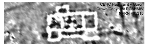
Uchod: Dangosodd yr arolwg ffisegol gynllun llawr adeilad nodweddiadol ac iddo sylfeini cerrig a dwy aden ymestynnol, a chadarnhaodd gwaith cloddio mai fila Frythonig-Rufeinig oedd yno. Mae'r adeilad yn debyg i'r enghreifftiau o filâu Rhufeinig â 'choridor adeiniog' yn ne Cymru ac yn Lloegr. Mae'n wynebu'n union tua'r de er mwyn i gymaint â phosibl o heulwen lifo i'r coridor a'r ffenestri blaen. Mae'r 'tyllau' du sydd i'w gweld yn yr ystafell ganolog i'w cael mewn aelwydydd a osodwyd mewn clai.